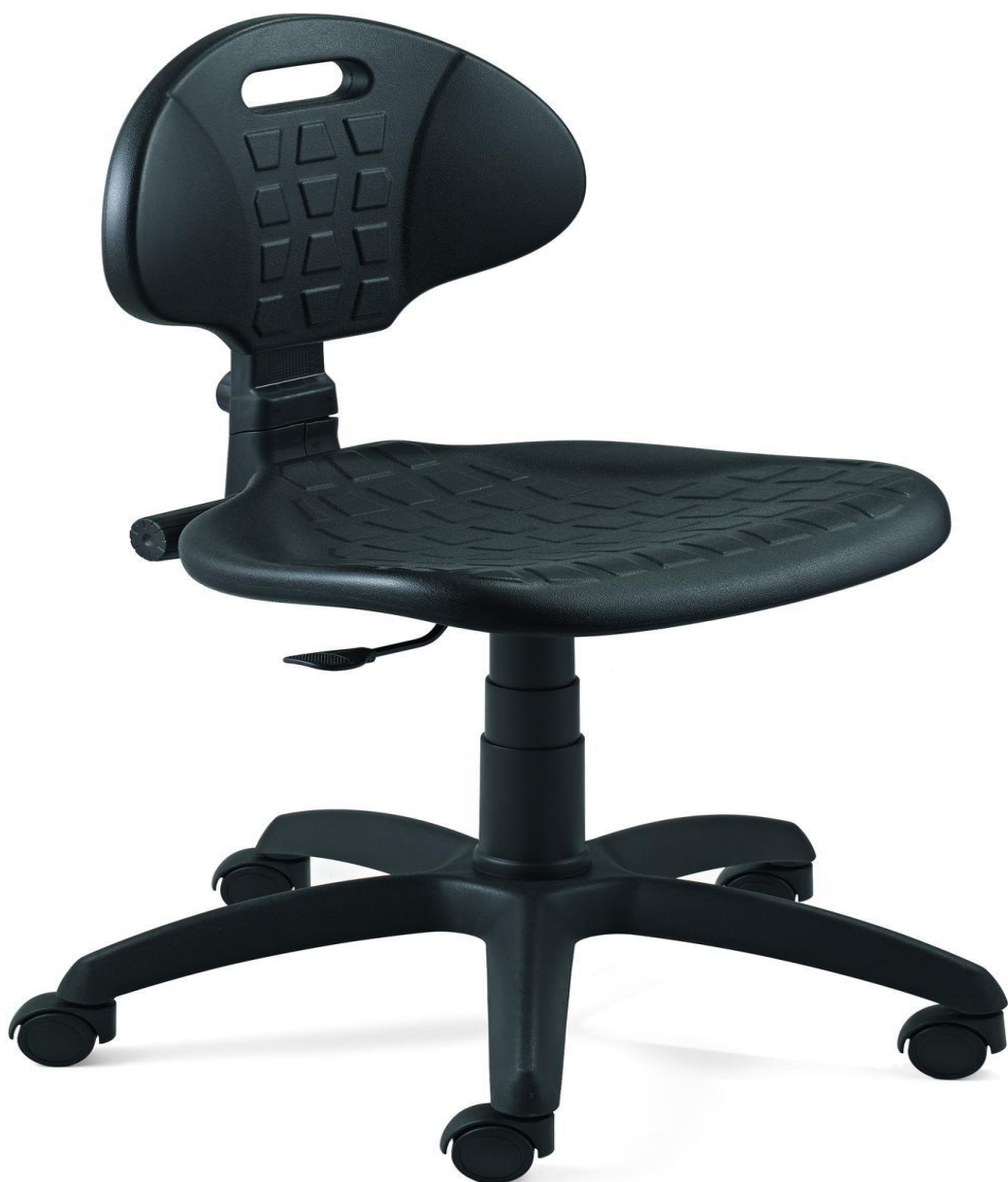
Слика 3 (Изглед столице 2)